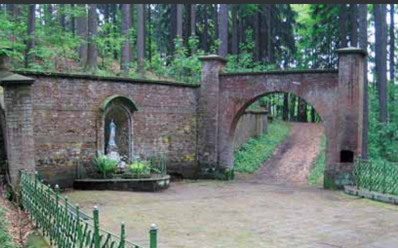
↑ Brána u suchodolské kapličky

a už cinkaly první korunky na účtu sbírky. Věrná kopie původní kaple byla vysvěcena 8. července 2012. Z Police nad Metují k ní dojdete zhruba po 3 km, a to z náměstí po zelené k bývalému mlýnu Ochoz a dále po žluté, jež vede okolo kapličky i po části křížové cesty. Značka pokračuje na okraj Hlavňova, odkud je to co by kamenem dohodil do Suchého Dolu. Pomůže mapa KČT č. 26 Broumovsko. Hlavňov i Suchý Důl mají solidní autobusové spojení, a to i o víkendech.